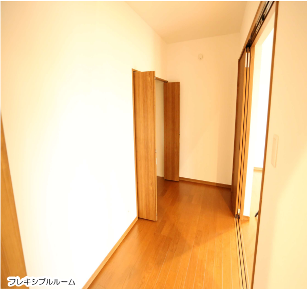
フレキシブルーム

・所在地/北本市東間2丁目280-1、421-1・交通/JR高崎線「北本駅」徒歩9分・土地面積/148.23㎡ (44.83坪) 建物面積: 103.5㎡ (31.24坪)・販売価格3,380万円・土地権利/所有権・地目/宅地・都市計画/市街化区域・用途地域/第一種低層住居専用地域・建ぺい率50% ・容積率/80%・地勢/平坦・完成年月/令和1年11月・引渡日/即・建築確認番号/第SJK-KX195304100号・現況/更地・引渡日/即・接道状況/西側4m位置指定道路・設備/東京電力・都市ガス・公営水道・取引形態/売主