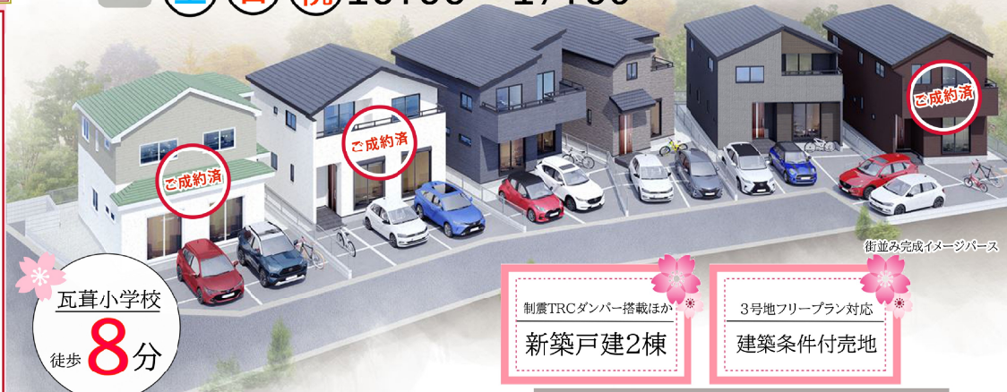
街並み完成イメージパース

木のぬくもりが嬉しい天井高約2.7Mの梁見せ天井 ファミリークローゼットと大型土間収納が嬉しい機能的なプラン