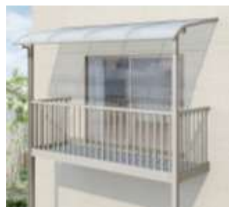
ビューステージHスタイル用屋根タイプ