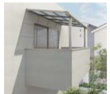
造り付けバルコニー用屋根タイプ