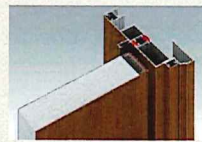
ドアの断面イメージ